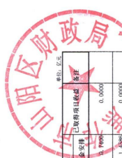
2024年-2025年4.0811 三阳区发行新增地方政府专项债券情况表