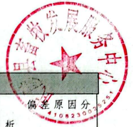
附表 1 自评价评分表